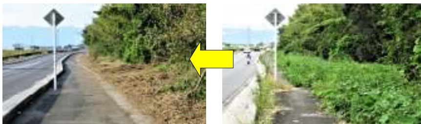
歩道を覆いつくしていた雑草がきれいに除草されました

野洲市の来年度予算がこれから編成されます。福祉・教育・環境・産業など、ご要望をお寄せください。予算に反映できるよう市長に予算要望します。