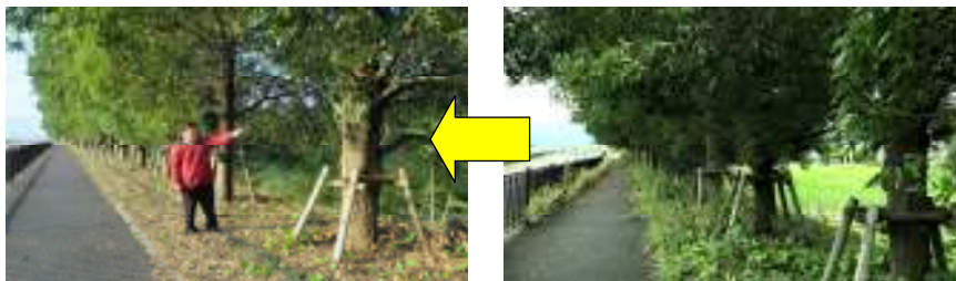
歩行すれば頭にかかるほどの枝葉でしたが枝払いされました