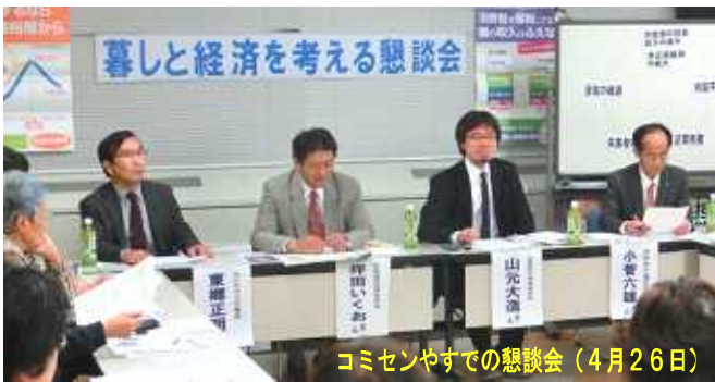
コミセンやすでの懇談会（4月26日）

4月26日に「暮らしと経済を考える懇談会」が開催されました。『雇用の拡大と賃上げこそデフレ脱却の道』です。野洲市でも不況で市民の暮らしも大変です。市民の声を大いに市政に届けたいと思います