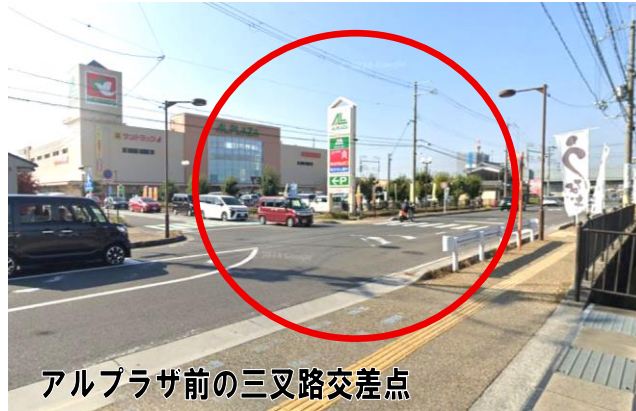
アルプラザ前の三叉路交差点

同交差点は小篠原からの歩行者の道路横断時に、自動車の三叉路右左折で安全確認がしにくい形状です。同交差点を利用する歩行者から「横断歩道を渡つたのに目前を自動車ですり抜けて怖かった」など不安の声が寄せられています。