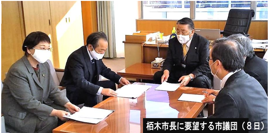
栢木市長に要望する市議団(8日)

栢木市政になり初めての市予算の編成が進められています。共産党市議団は8日、市長に対して、コロナ禍市民の暮らしを守る野洲市予算の編成を行うよう求めました。