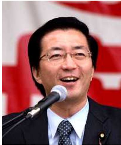
山下よしき参院議員